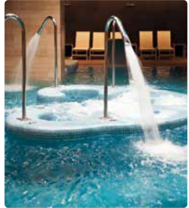
Piscine thermale à base d'eau de mer

Les piscines sont des systèmes en boucle semi-ouverts qui souffrent constamment des pertes d'eau à mesure que leur eau s'évapore. Les piscines demandent un entretien constant et nécessitent d'ajouter différents produits chimiques pour lutter contre les bactéries, les algues et conserver une bonne qualité d'air, conformément aux normes imposées. Vulcan améliore nettement la qualité de l'eau et renforce les propriétés de certaines substances.