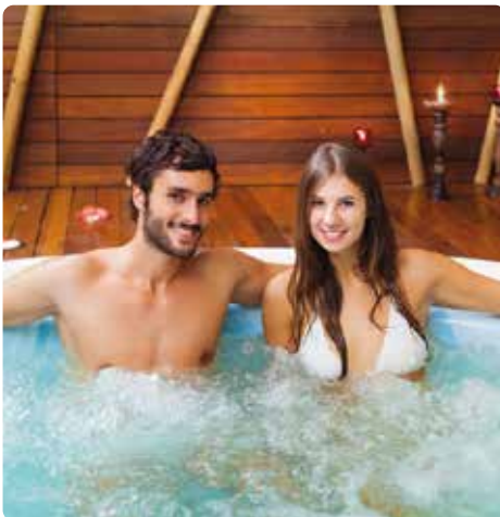
Bain bouillonnant d'une installation de bien-être