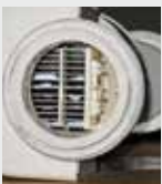
Filtere de piscine