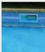
Ligne d'une piscine